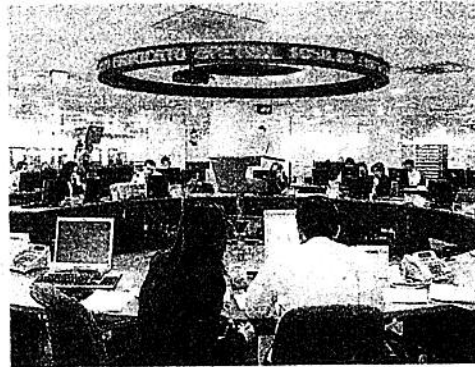
Ayer, el Índice Colcap de la Bolsa de Valores de Colombia tuvo un nuevo repunte que completó la cifra de crecimiento en el año.

Si bien el indicador marcó números rojos a lo largo de la sesión, al cierre repuntó, con lo